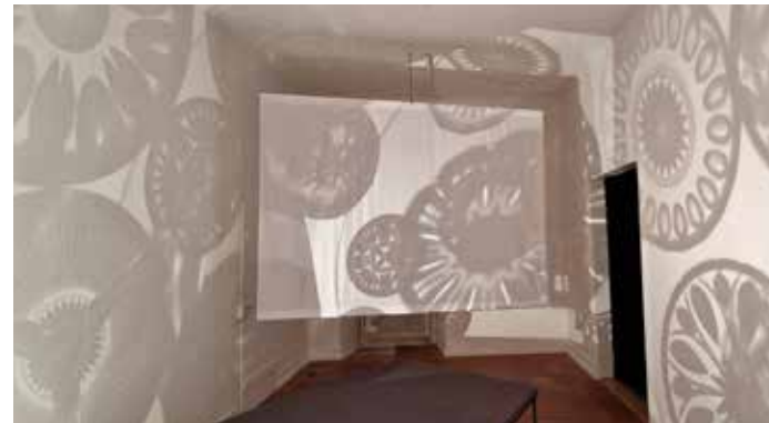
Fiat Lux 2, Lichtinstallation © Beate Gabriel

Ausstellungen in Aalen, Blaubeuren, Heidenheim, Meran (Italien), Ravensburg, Ulm und Würzburg