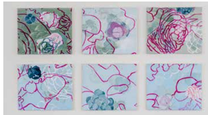
ser 1-6, Öl auf Leinwand © Oliver Vogel