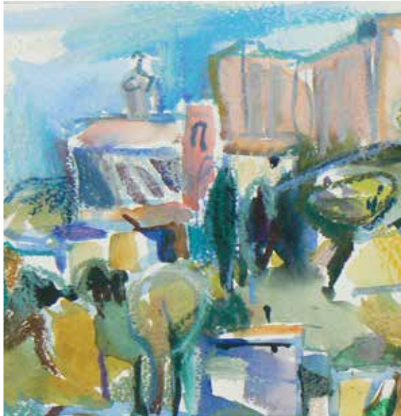
Ausschnitt aus dem Aquarell Lançon © Ursula Geggerle-Lingg