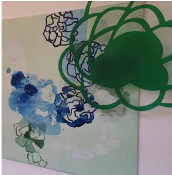
magis 2, Öl auf Leinwand, Plexiglas © Beate Gabriel

Pflanzliche und organische Strukturen bilden die motivische Grundlage von Beate Gabriels abstrakter Malerei. Diese hat sie in den letzten Jahren immer stärker von der Bildfläche zum Raum hin erweitert.