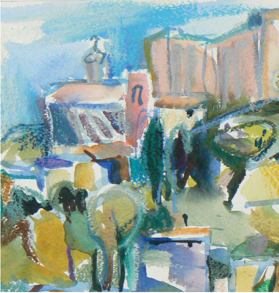
Ausschnitt aus dem Aquarell Lançon © Ursula Geggerle-Lingg